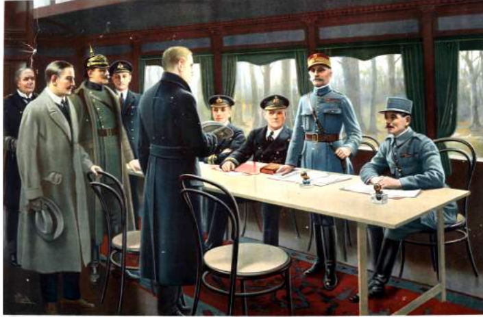
Le Maréchal Ferdinand Foch et Matthias Erzberger pour la signature de l'armistice.

Les cloches des églises de France sonnent à toute volée pour annoncer et célébrer l'armistice signé quelques heures plus tôt par le Maréchal Foch et Matthias Erzberger.