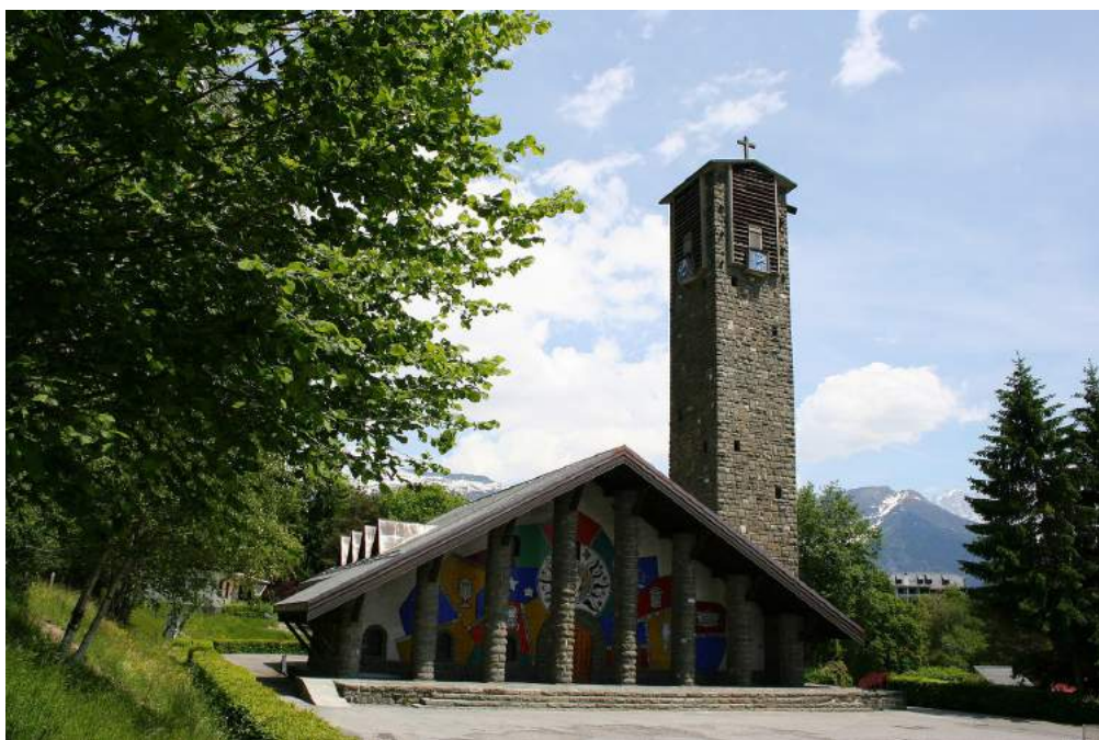
Eglise Notre-Dame-de-Toute-Grâce – Plateau d'Assy Extérieur