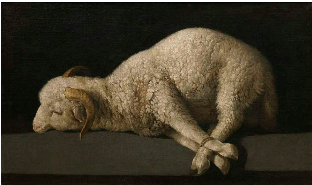
Agnus Dei – Francisco Zurbarán Huile sur toile – circa 1635/1640 – Musée du Prado - Madrid