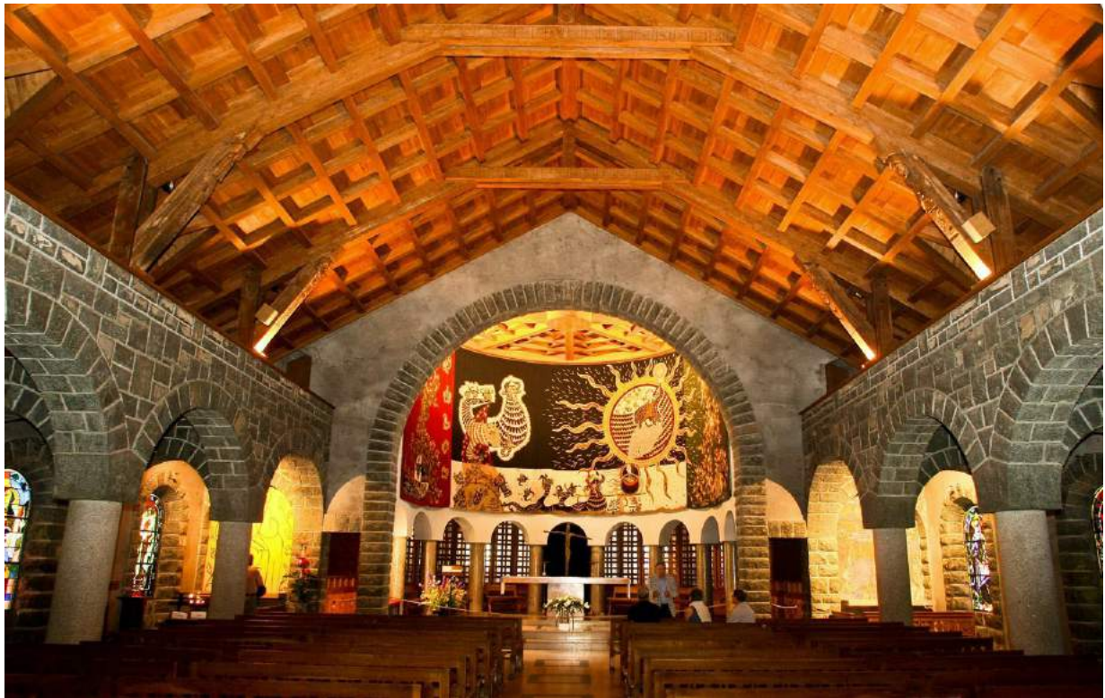
Eglise Notre-Dame-de-Toute-Grâce – Plateau d'Assy Intérieur

Pour la croix qui doit être placée dans le chœur de l'église, le choix se porte sur une artiste athée : Germaine Richier.