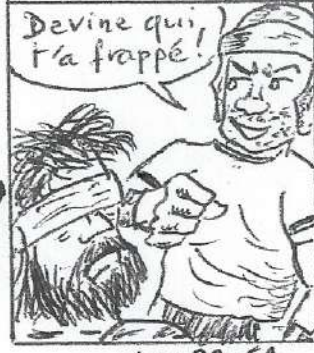
Lc 22, 64