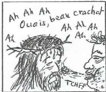
Mc 15, 16-20