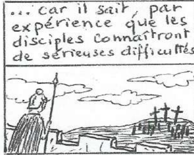
Mt 27, 32-56