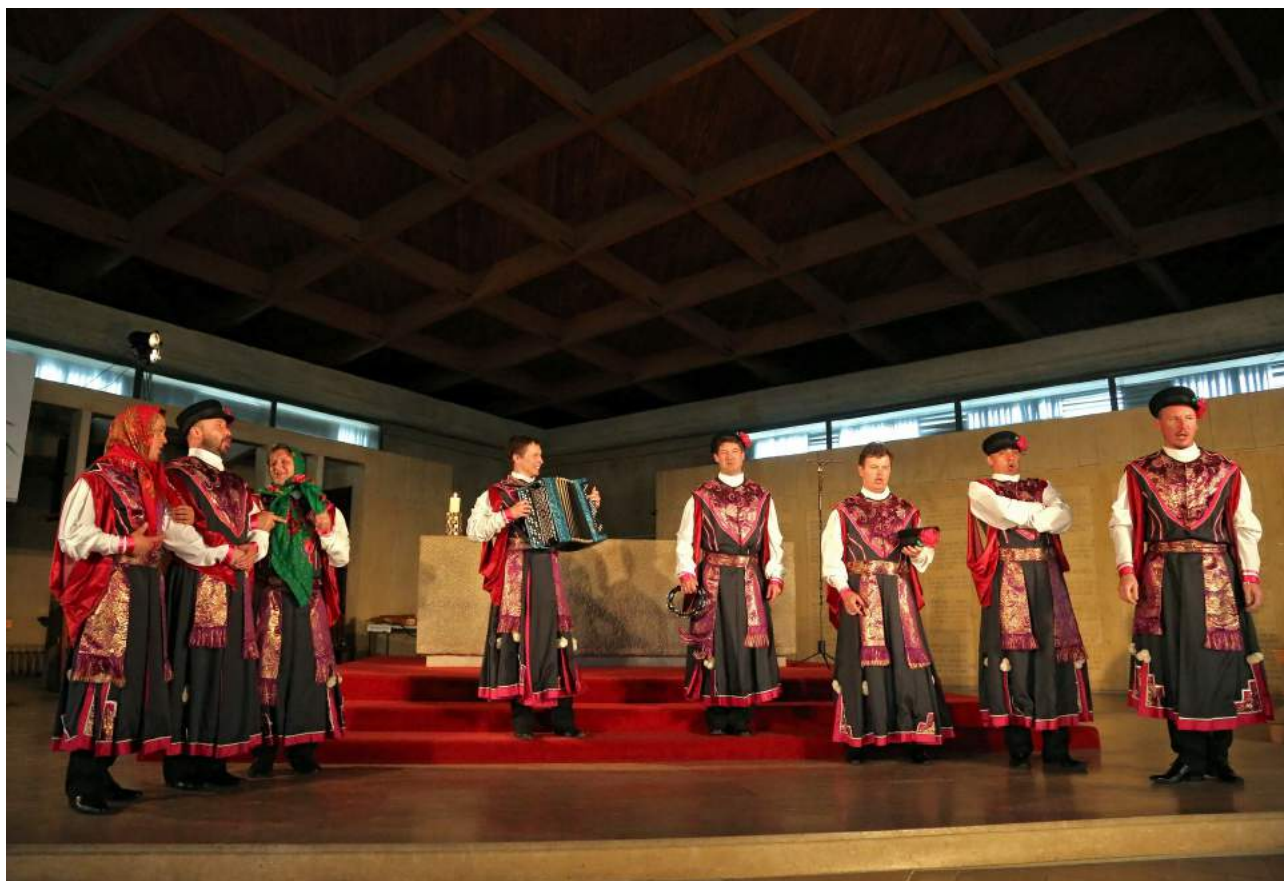
Eglise Saint-Jean Dole