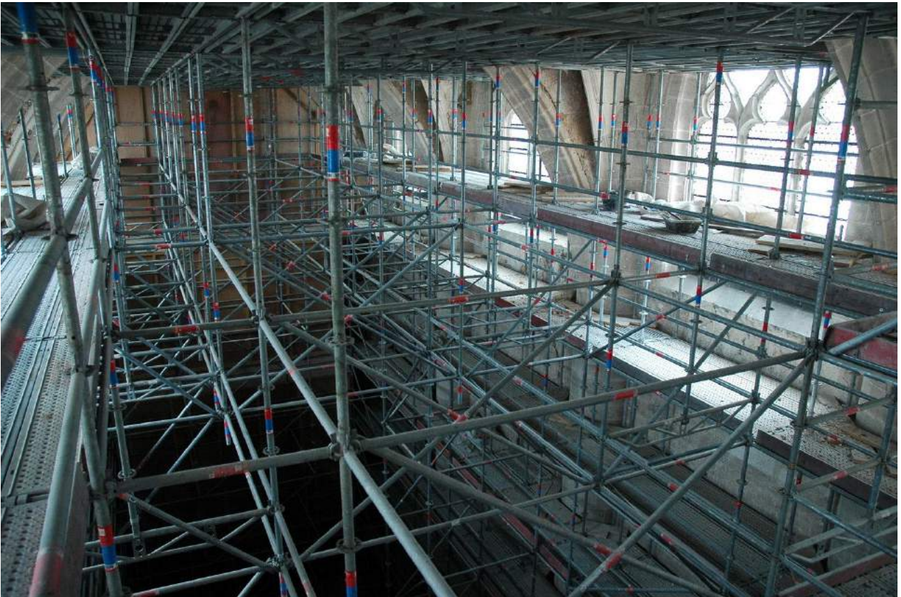
Collégiale N.D. de Dole