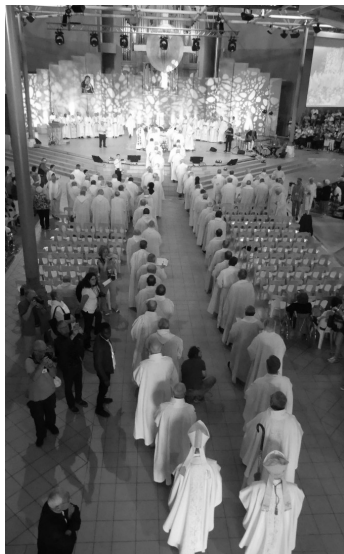
La messe d'envoi festive, belle et priante