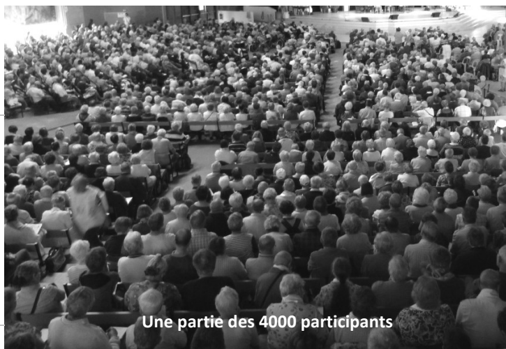
Une partie des 4000 participants

Venus de tous les départements de France, plus de 4000 chrétiens retraités, de 58 à 97 ans se sont retrouvés pendant trois jours à Lourdes pour s'interroger sur les grands défis qui se posent à notre monde. Pour la circonstance, l'Eglise Sainte Bernadette s'était transformée en amphi.