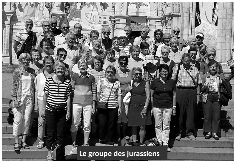
Le groupe des jurassiens

Nous étions 48 jurassiens , membres ou sympathisants du MCR à suivre le programme riche de ces trois journées, en particulier autour de tables rondes réunissant des personnalités de haut niveau sur quatre thématiques: le vivre ensemble, la famille, la santé, l'écologie ; l'encyclique Laudato si' du pape François tenait lieu de fil rouge.